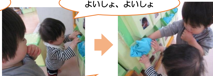
よいしょ、よいしょ